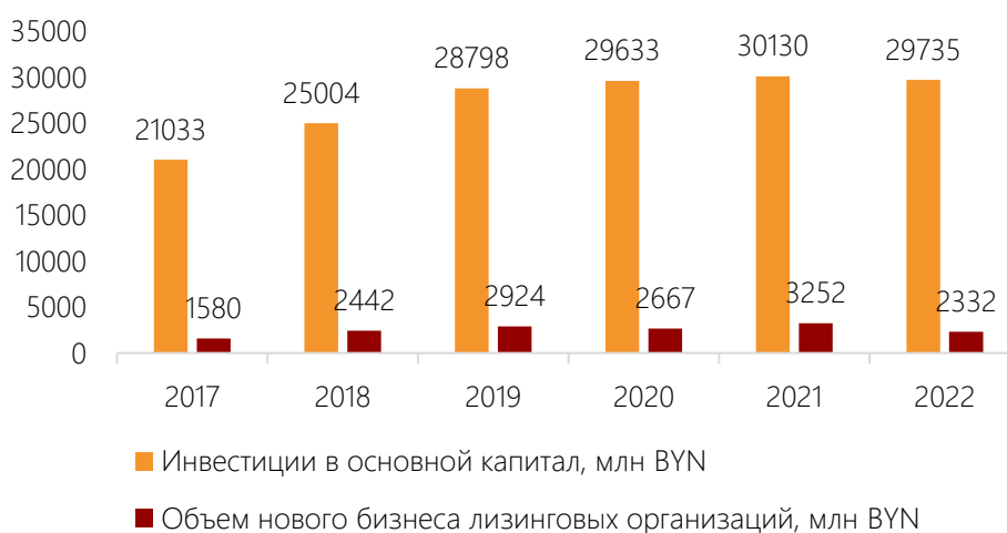
Рисунок - Инвестиции в основной капитал и суммарный объем нового бизнеса лизинговых организаций Республики Беларусь в 2017-2022 гг.

Суммарный объем нового бизнеса белорусских лизинговых организаций и банков составил 907,6 млн EUR и уменьшилось по отношению к 2021 году на 22,69% в национальной валюте и на 16,13% в иностранной валюте (EUR). Доля лизинговой деятельности в экономике Беларуси составила 1,88% от ВВП, 10,79% к инвестициям в основной капитал и 29,3% к затратам на приобретение машин, оборудования, транспортных средств. Следует отметить, что по уровню проникновения в экономику, белорусская лизинговая отрасль сопоставима с показателями развитых экономик мира.