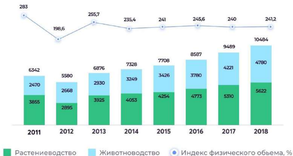
Диаграмма 1. Динамика производства в сельском хозяйстве в (млн. $)

По оценкам специалистов, сельскохозяйственная отрасль Казахстана обладает высоким экспортным потенциалом, на что указывают следующие преимущества: