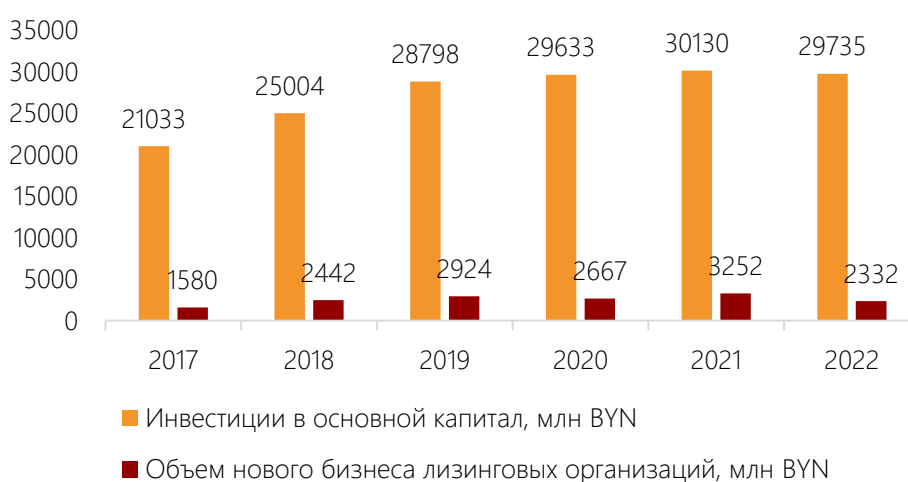
Рисунок - Инвестиции в основной капитал и суммарный объем нового бизнеса лизинговых организаций Республики Беларусь в 2017-2022 гг.

Суммарный объем нового бизнеса белорусских лизинговых организаций и банков составил 907,6 млн EUR и уменьшилось по отношению к 2021 году на 22,69% в национальной валюте и на 16,13% в иностранной валюте (EUR). Доля лизинговой деятельности в экономике Беларуси составила 1,88% от ВВП, 10,79% к инвестициям в основной капитал и 29,3% к затратам на приобретение машин, оборудования, транспортных средств. Следует отметить, что по уровню проникновения в экономику, белорусская лизинговая отрасль сопоставима с показателями развитых экономик мира.