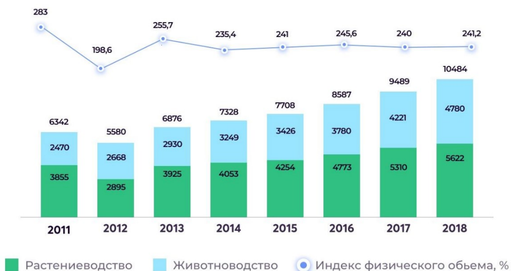
Диаграмма 1. Динамика производства в сельском хозяйстве в (млн. $)

По оценкам специалистов, сельскохозяйственная отрасль Казахстана обладает высоким экспортным потенциалом, на что указывают следующие преимущества: